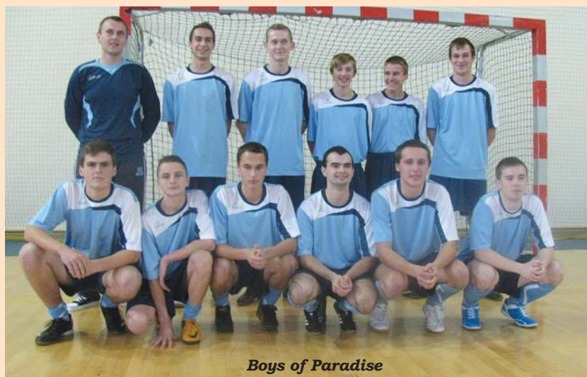
Boys of Paradise