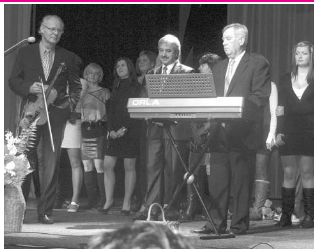
Koncert otvorili organizátori s piesňou Leto za mláďa